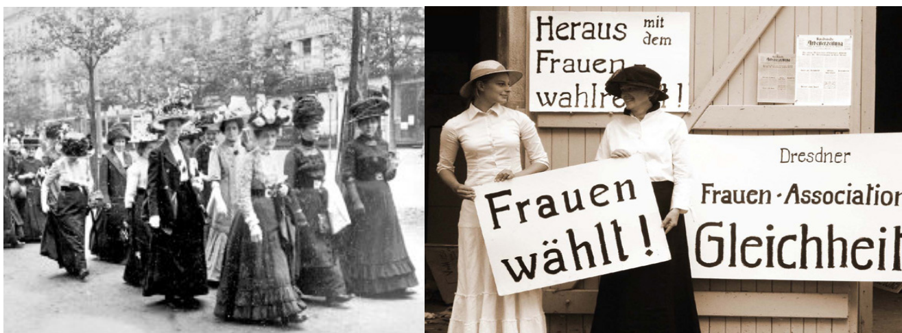
Kampf um politische und ökonomische Gleichstellung und das Frauenwahlrecht.

Die proletarische Frauenbewegung hatte ihre eigenen Kongresse und Forderungen